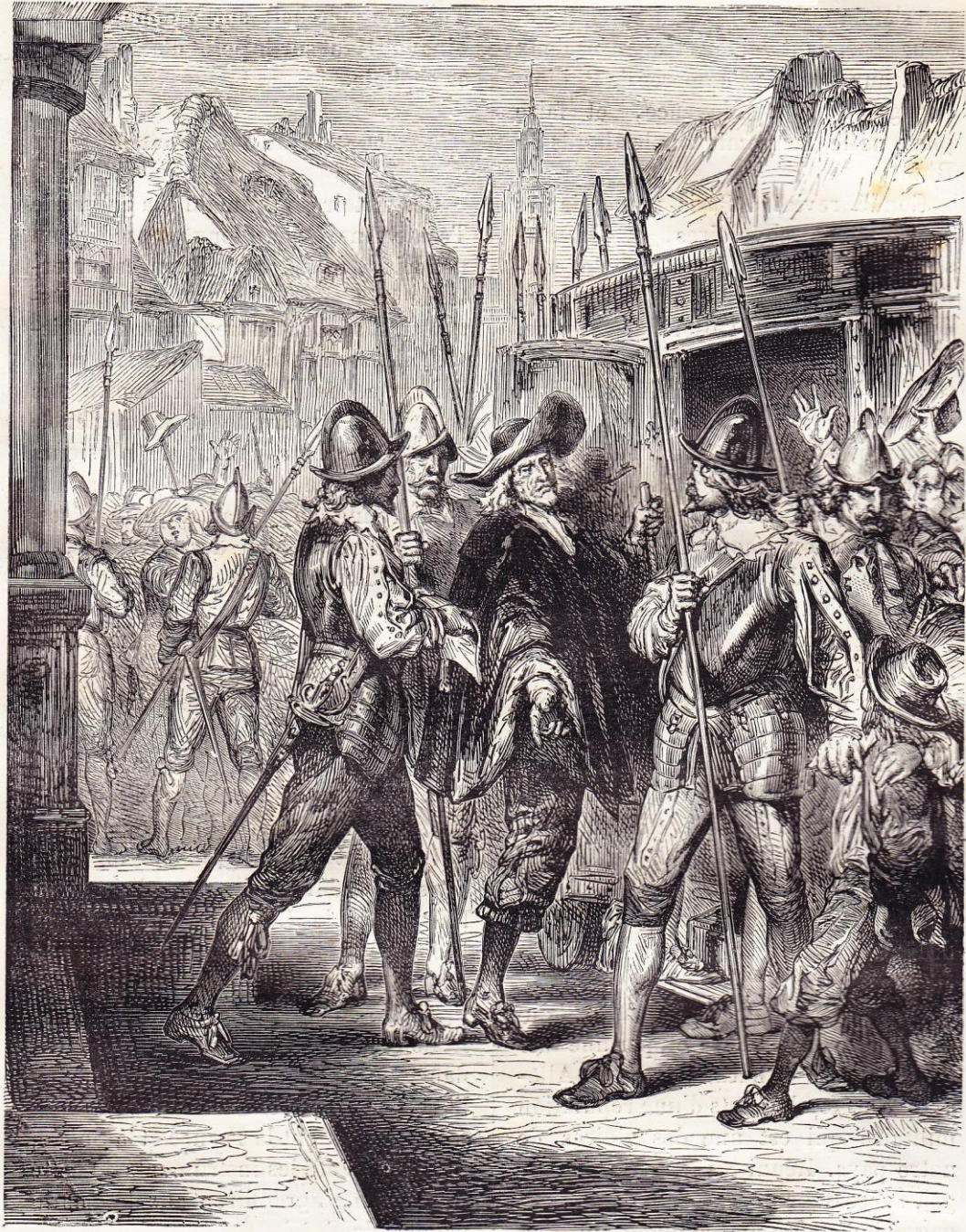
Arrestation de Broussel (1648).

mands, l'Elbe, l'Oder et le Weser, et trois voix à la Diète.