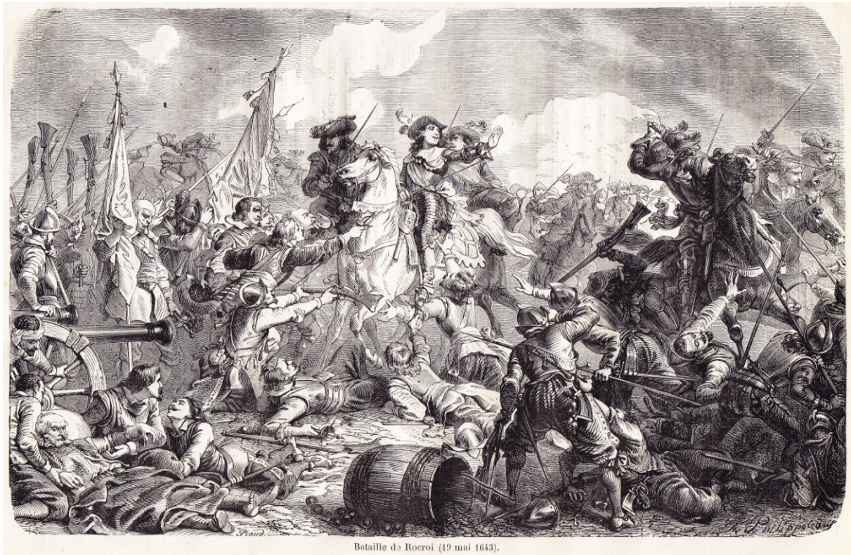
Bataille de Rocroi (19 mai 1643).